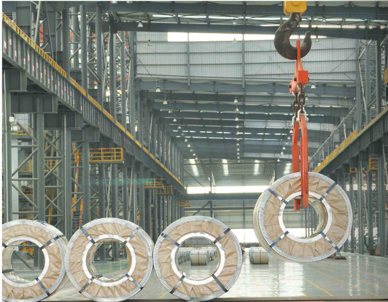
HOT DIP GALVANIZED PRODUCTS