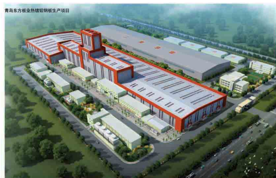
青岛东方板业科技有限公司筹建中的年产40万吨热镀铝合金钢板生产项目

远大（青岛）钢板有限公司是远大集团在青岛设立的销售分公司，该公司成立于2013年，位于中铁青岛中心大厦，是一家集技术咨询、国内外贸易、售后服务于一体的多元化公司。该公司利用青岛得天独厚的优势，在国内国际业务方面不断深入与开展，公司贸易规模不断得到扩大，同时为公司进一步走出去战略奠定了基础。下一步，公司将陆续在华南、西南地区设立办事处，期使公司业务范围进一步壮大，在市场中稳步前进。