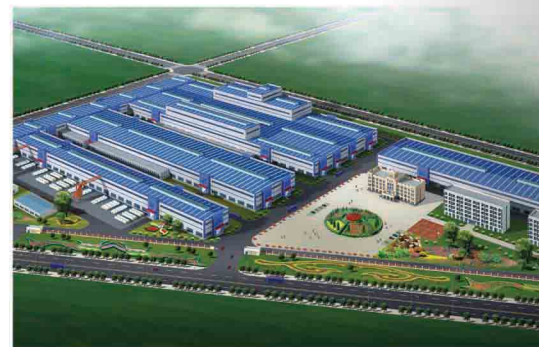
筹建中的在俄罗斯高档冷轧、镀锌、彩涂板项目